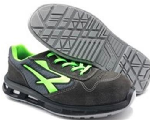
FOTO CAMPIONE PHOTO OF SAMPLE